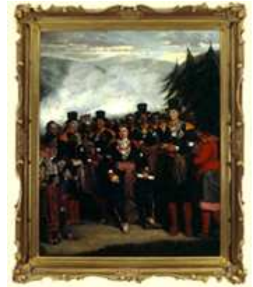
Présentation d'un chef nouvellement élu au conseil de la tribu huronne de Lorette, 1840 Huile sur toile

Le Château Ramezay reste l'un des rares témoins de ce temps. Ici, les murs parlent: découvrez dans les voûtes du Château la vie quotidienne à Montréal au XVIII e siècle.